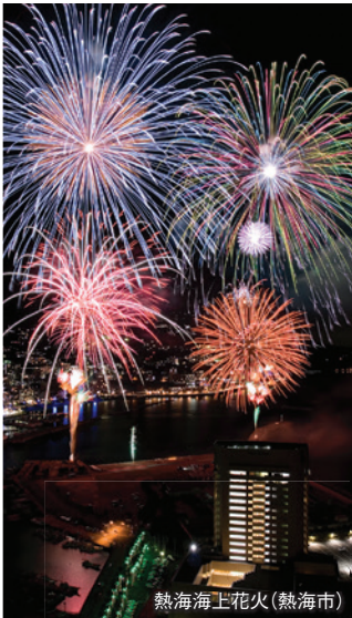
熱海海上花火(熱海市)