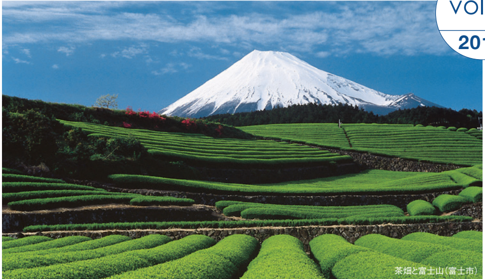
茶畑と富士山(富士市)