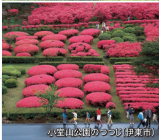
小室山公園のつつじ(伊東市)