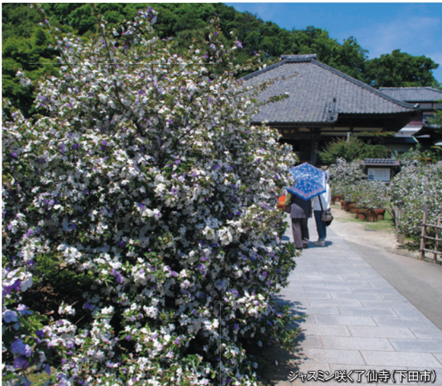
ジャズミン咲く了仙寺(下田市)