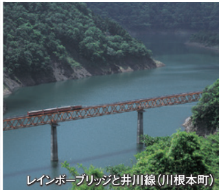
レインボーブリッジと井川線(川根本町)