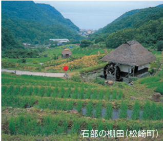
石部の棚田(松崎町)