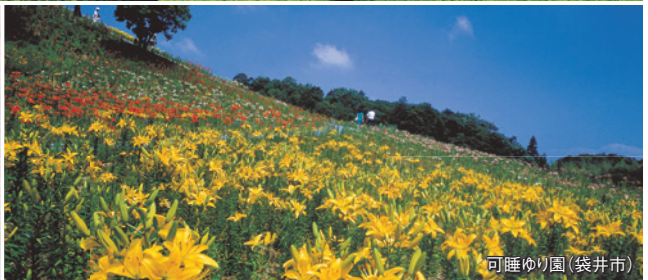
可睡ゆり園(袋井市)