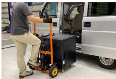
可搬型蓄電池交換の様子