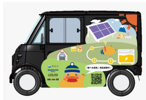
一人乗りミニカー「クロスケ」（nicomobi 製）

静岡市、静岡ガス、LEALIAN および nicomobi は、太陽光発電から生じる余剰電力を充電した可搬型蓄電池や、可搬型蓄電池を着脱できる EV をシェアリングするビジネスモデルの構築を図るプロジェクトを進めています。本プロジェクトは、静岡市主催のビジネスコンテスト「UNITE2024※1」にて最優秀賞を受賞したものであり、再生可能エネルギーの最大活用によるモビリティ分野におけるカーボンニュートラル化の推進、モビリティの電動化の推進、地域防災力の向上等を目指しています。