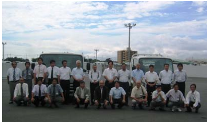
※参加いただいた皆様で記念撮影

CNG車ならではの静粛性、クラストップのパワーとすぐれた燃費はそのままに最新の燃料制御システムを備えたエンジンに磨きをかけ一段とクリーンに進化したエルフCNG-MPI。実用可能な低公害車のなかで最もクリーンな排出ガス性能を誇ります。新たにアイドリングストップ&スタートシステムを装備し、よりいっそう環境に配慮しました。さらに新普通免許対応車や新開発のハイキャブ、操作性が大幅に進化したスーサーExをはじめエクステリア、インテリア、シャシの細部にわたるまで一新。商用車にふさわしい実用性を兼ね備えた最先端の低公害トラックです。