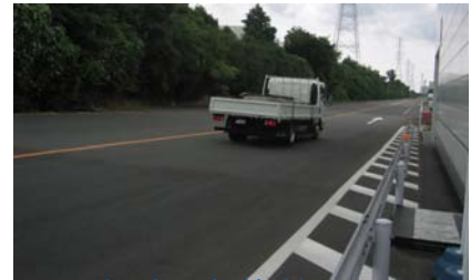
※いすゞ自動車(株)様のテストコース