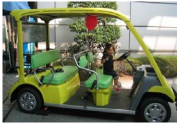
←天然ガスで 走るゴルフカート 「コナンJr.」