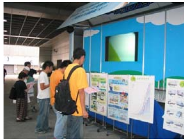
↑ クイズラリーの参加者 金・土の2日間で900名!!!