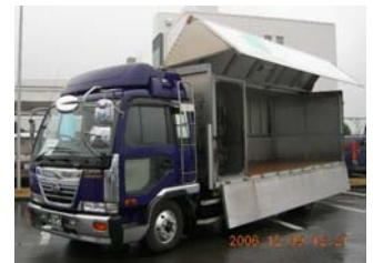
↑ 長貫運送(有)の天然ガス トラック

屋外では、長貫運送のトラック、富士急静岡バスの乗り合いバスをはじめ、佐川急便のトラック、米久ベンディングの営業車など実際に市内で活躍している車両や、また天然ガス自動車PRトラック「コナン号 & コナンJr.」も展示され、あいにくの荒天でしたが、環境に関心の高いお客様を中心に熱心に見学されていきました。試乗車として用意した2tトラックのいすゞエルフやトヨタプロボックスに試乗されたお客様は、静かな走行や振動の少ない車内に驚かれています。