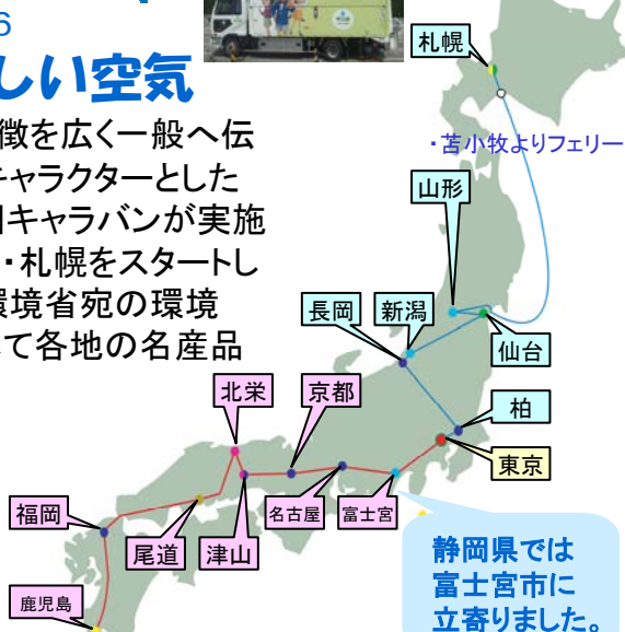
静岡県では富士宮市に立寄りました。

また、ご当地名産を全国に！ということで、 ★平成17年度B-1グランプリ初代受賞商品で、コシのある麺とソース・肉かすが特徴の富士宮やきそば（マルモ食品工業） ★平成17年度静岡ふるさと食品コンクール静岡県議会議長賞受賞の朝霧高原の生乳と天塩で作った無添加の手で裂いて食べるチーズ（富士ミルクランド） ★お菓子の配送を天然ガス自動車で行っている銘菓「田子の月」がキャラバンのために特別にオリジナルで作った紅白まんじゅう（田子の月）が、キャラバン隊に授与され東京に運ばれました。