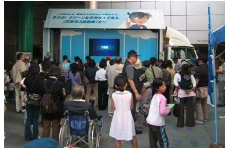
↑「コナン号」に設置されたモニターを使っ たNGVビンゴ大会の様子

10月20日(金)・21日(土) 静岡市 ツインメッセ静岡で第4回しずおか環境・森林フェアが開催され、屋外ブースに天然ガス自動車PRカー「コナン号 & コナンJr.」を出展しました。多くのお客様にクイズラリーやビンゴ大会に参加していただき、環境にやさしい天然ガス自動車の特徴を学んでいただきました。ブースは終始賑わいをみせ、2日間で897名の来場者がありました。