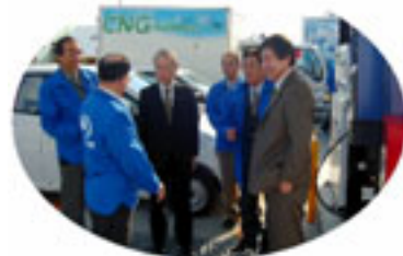
同じスタッフジャンパーを着用。来場した沼津市長様に充填設備などをご説明申し上げました。