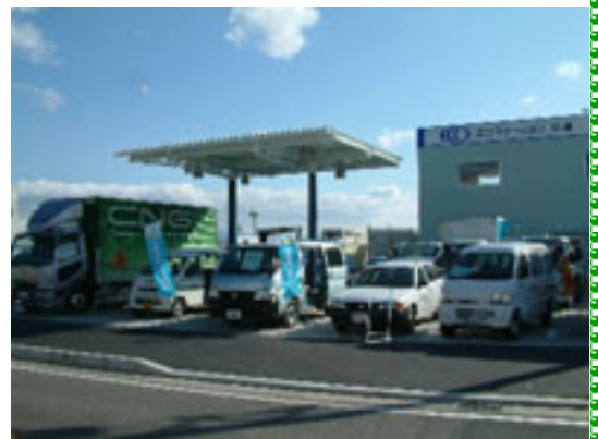
敷地内におさまりきれないほどたくさんの車両を展示していただきました。