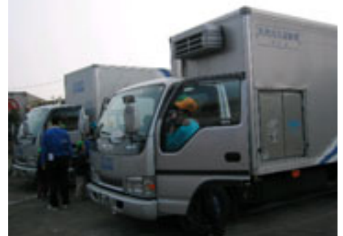
佐川急便(株)所有の天然ガス自動車(手前)とディーゼル車(奥)。排ガス比較実験も行った。