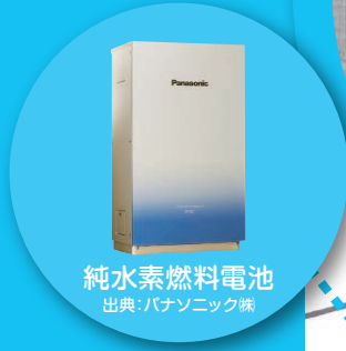
純水素燃料電池